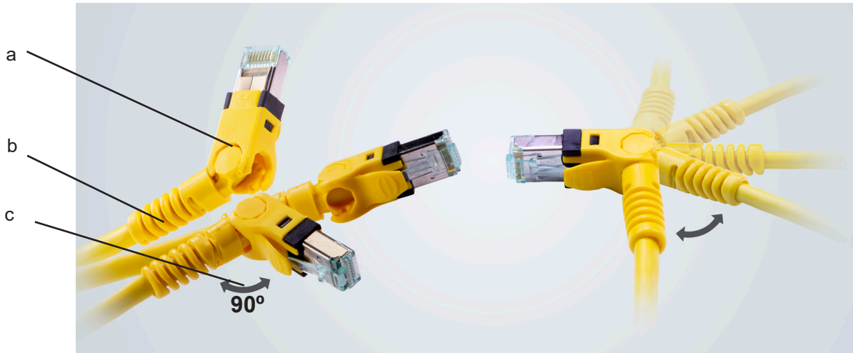
a. RJ45 Stecker b. Knickschutztülle c. Winkel (max. 90°), siehe Typenblatt

Angle change: top or bottom / left or right Select the cable direction of the RJ45 connector (a) according to your application.